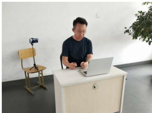
图 1 考生“双机位”设备摆放布置示意图